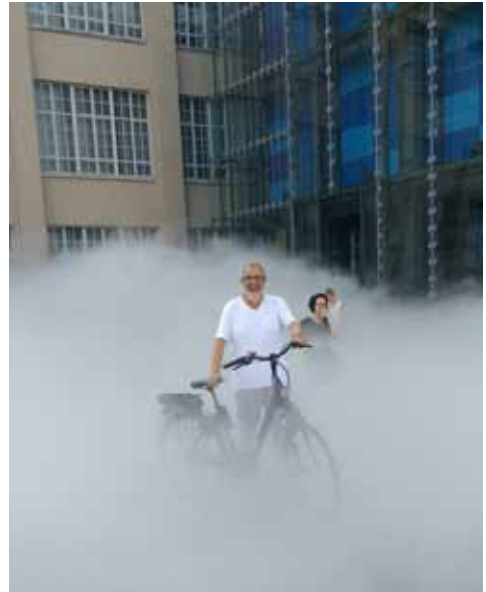
Ein Tag Pause in Karlsruhe – Nebel kann Teil von Kunst sein

Nach gut einer Stunde ist alles in trocknen Tüchern und der Gastbetrieb darf mit dem