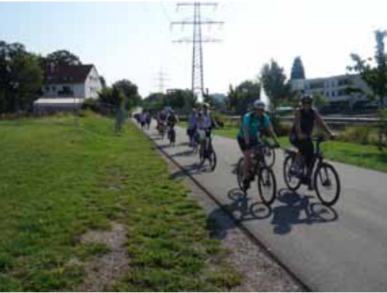
Frauenradtour in Essen