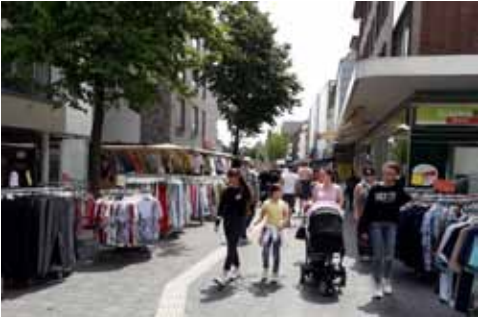
Horster Str. GLA - der künftige RS nach GE