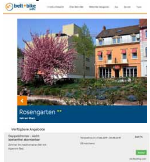
Foto: screenshot des Buchungsvorgangs

In den letzten Jahren hat bett+bike auch einen digitalen Sprung nach vorne gemacht. Seit 2018 kann man die einzelnen Gastbetriebe über die Homepage oder die App suchen und das Zimmer online buchen. Das gilt zumindest für 3.000 Betriebe, denn nicht alle Betriebe sind im Internet unterwegs. Interessant ist, dass die online-Buchung nicht direkt über bett+bike erfolgt, sondern über das Buchungsportal booking.com erfolgt.