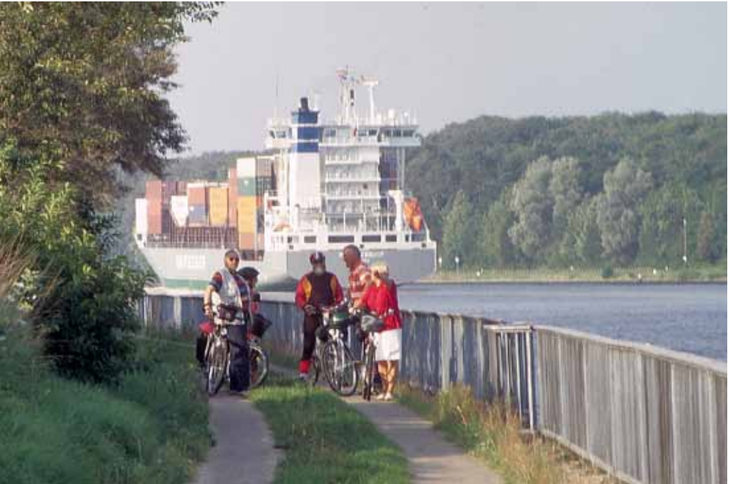
Saga Sapphire

bei an der längsten Sitzbank der Welt mit 575,75 Metern und schon bald taucht das Wahrzeichen der Stadt auf, die 43 Meter hohe Eisenbahnbrücke, auch „Eiserne Lady“ genannt. Leider fiel die an ihr hängende spektakuläre Schwebefähre 2016 einem Zusammenstoß mit einem Schiff zum Opfer, ein Neubau soll bis 2020 fertig sein. Direkt an der Hochbrücke ist die Schiffsbegrüßungsanlage als weitere Attraktion, hier bekommt man Informationen über die den Kanal passierenden Schiffe.