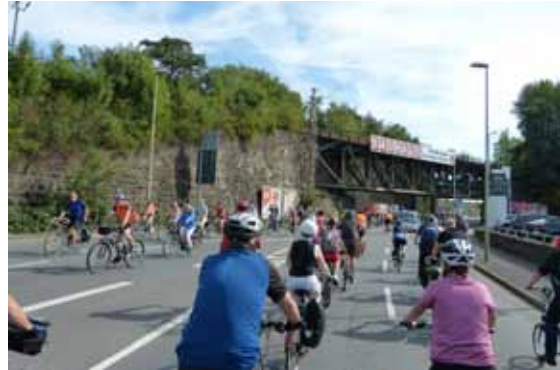
Demonstration als Radrout durch Hagen

Auf der Abschlusskundgebung versprach der Hagener Oberbürgermeister, mehr für den Radverkehr zu tun. Die Rote Laterne des Fahrradklimatestes sei Vergangeneit.