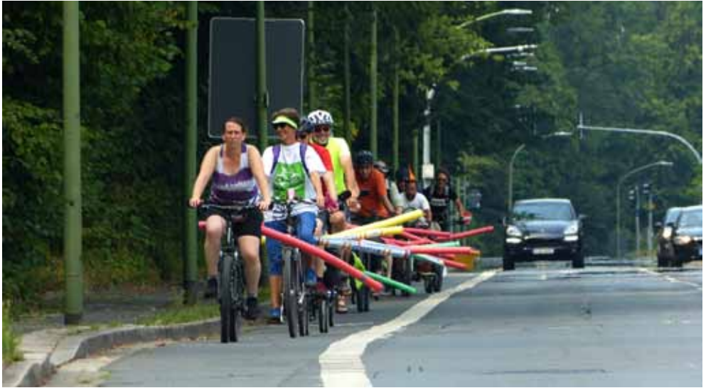
Sorgen für ausreichenden Seitenabstand – Fahrt mit Poolnudeln

Radfahrern einen Seitenabstand von mindestens 1,50 Metern einhalten, was aber gerade im innerstädtischen Verkehr nur in den seltensten Fällen auch wirklich eingehalten wird. Besagter Mindestabstand ist aber ein elementarer Bestandteil für mehr Sicherheit beim Radverkehr. Um dies zu unterstreichen, wurden die Schwimmhilfen einfach quer auf den Gepäckträger geschlallt, damit das Fahrrad optisch breiter wirkt.