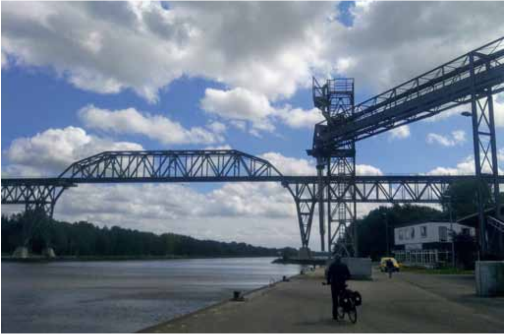
„Eiserne Lady“ Rendsburg