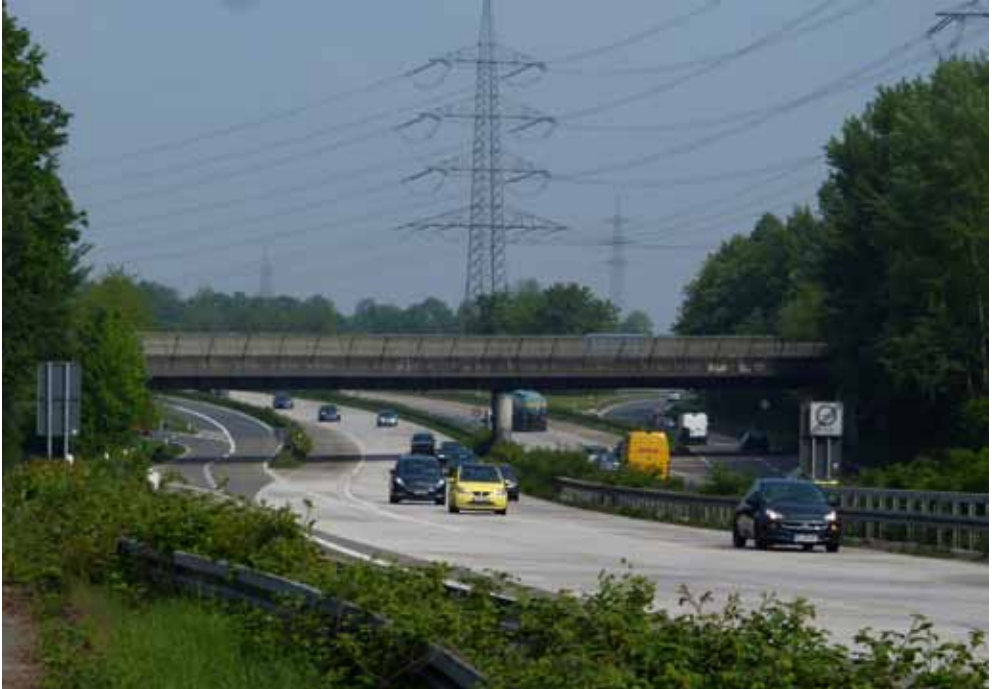
Die Brücke der ehemaligen Zechebahn Emil-Emscher über das Autobahnkreuz Essen-Nord

le ebenfalls Geschichte ist. Derzeit wird das Gelände komplett neu überplant.