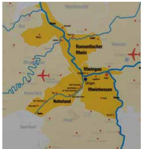
Foto eines Werbeplakats in Bingen. Heißt Rhein-Route auch Wein-Route?